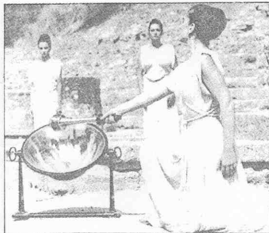
於，裝服代古著露卡絲達狄星女臘希▲ 鏡光聚形碟用利亞匹林奧臘希在日二十二 (真傳社新法)。火聖運奧燃引光陽太射反