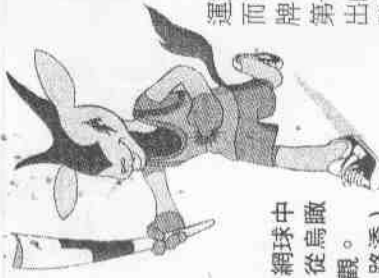
◀多哈亞運的網球中心已經落成，從鳥瞰圖看來十分壯觀。

話雖如此，劉翔並沒有因爲實力超出對手而鬆懈，他初抵達廣州，全心準備亞運，也拒絕媒體採訪。劉翔亞運金牌對他而言還是很重要的，他希望能奪取自己破紀錄的2006年畫下圓滿句點。