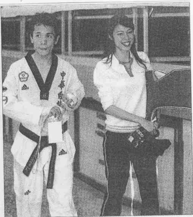
↑奧運金牌女將陳詩欣（右），陪男友陳維新參加全運會跆拳道賽，陳維新獲銅牌。