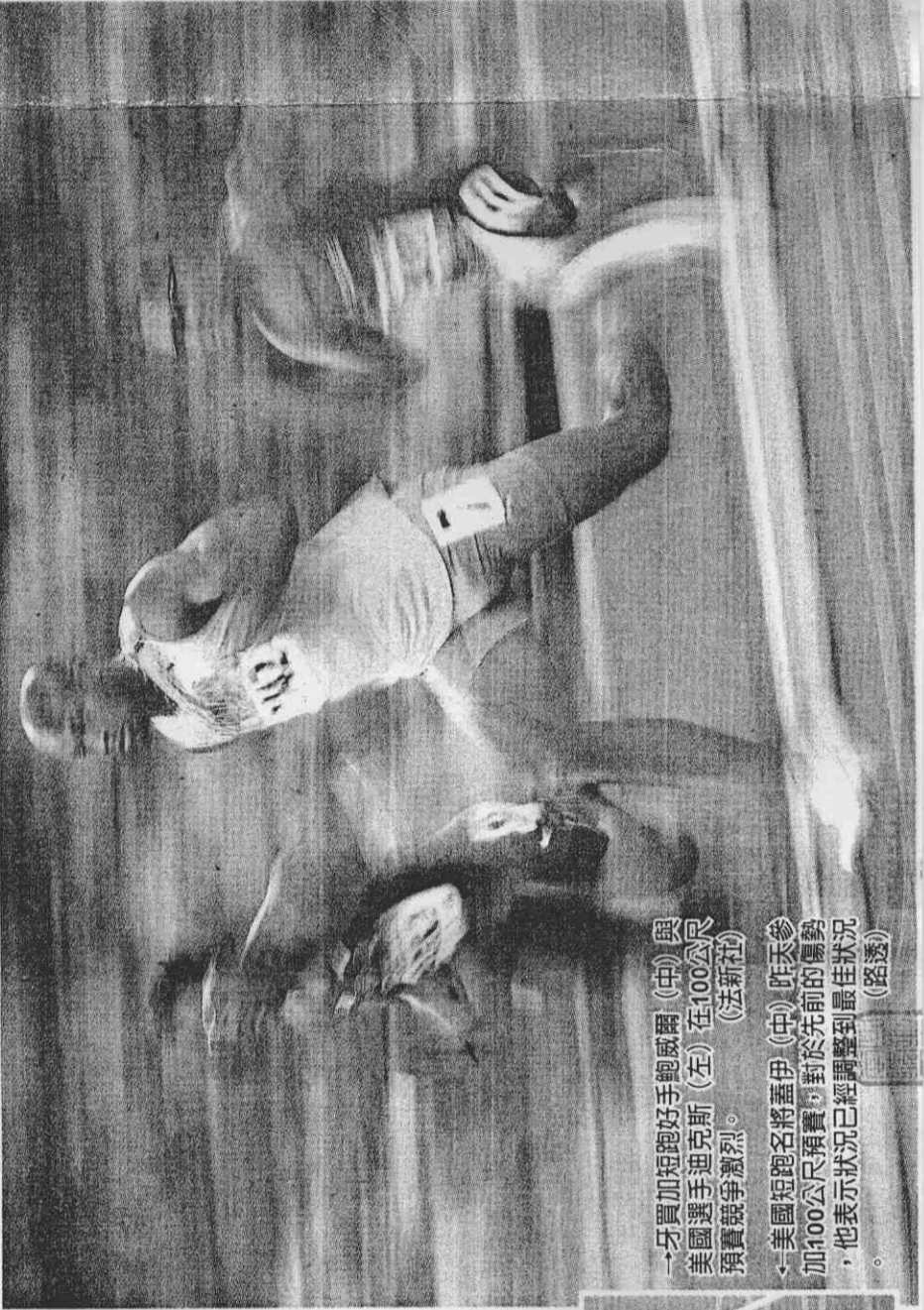
→牙買加短跑好手鮑威爾(中)與美國選手迪克斯(左)在100公尺預賽競爭激烈。 ←美國短跑名將蓋伊(中)昨天參加100公尺預賽，對於先前的傷勢，他表示狀況已經調整到最佳狀況。