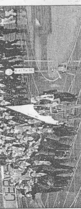
↑中華台北代表團排在地主國之前進場，全場觀眾起立報以熱情歡呼。