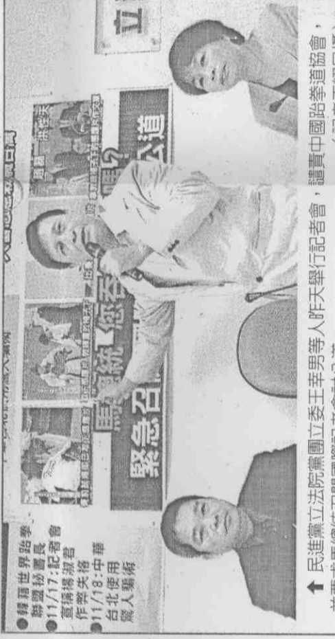
民進黨立法院黨團立委辛男等人昨天舉行記者會，譴責中國跆拳道協會，並要求馬總統召開國際記者會討公道。