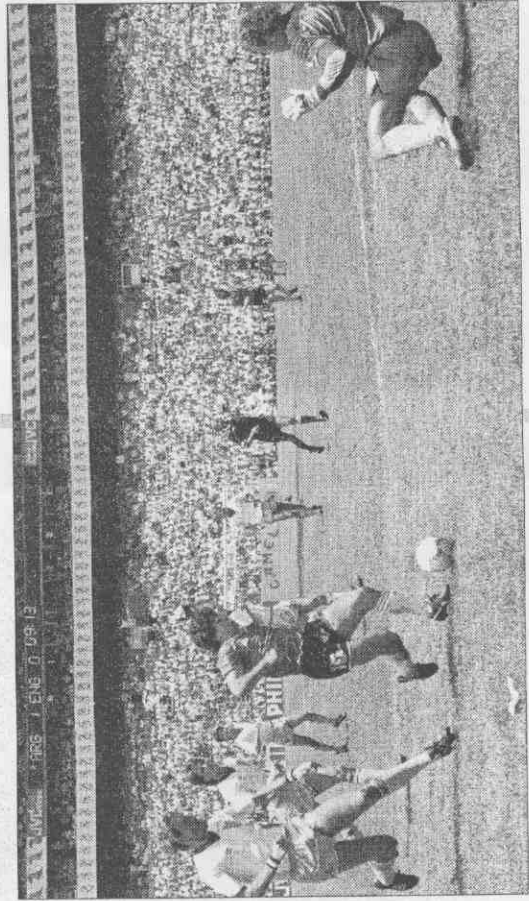
▲馬拉拉度納閃過英格蘭後衛布奇(左)後兵臨城下，英格蘭門將席爾頓(右)已經失去平衡，無力挽回，成就經典。