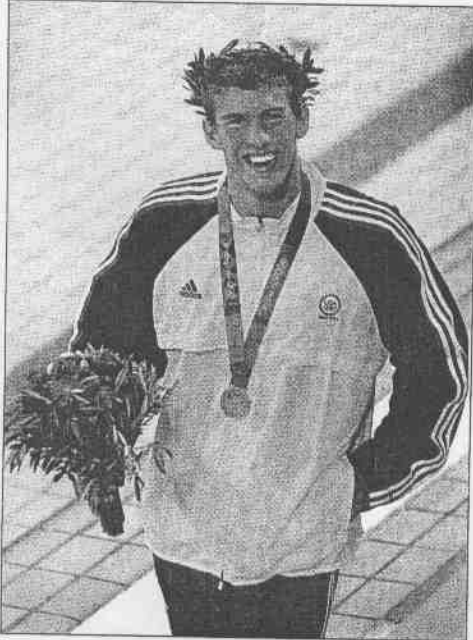
美國得以維持世界首強霸權關鍵人物，「下」屆北京奧運應仍是在右翼帶飛點。