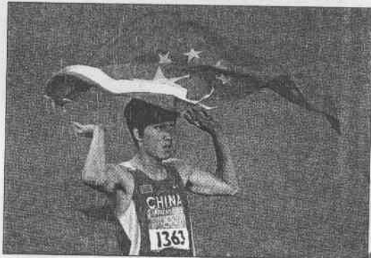
突破東方人在奧運田徑短跑項目奪金魔咒，大陸劉翔帶領亞洲走出新紀元，下屆奧運持續挑戰歐美強敵。