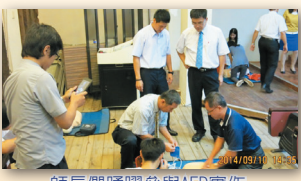
師長們踴躍參與AED實作