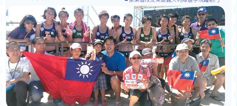
▲擊敗澳大利亞隊後與當地熱心華僑合影