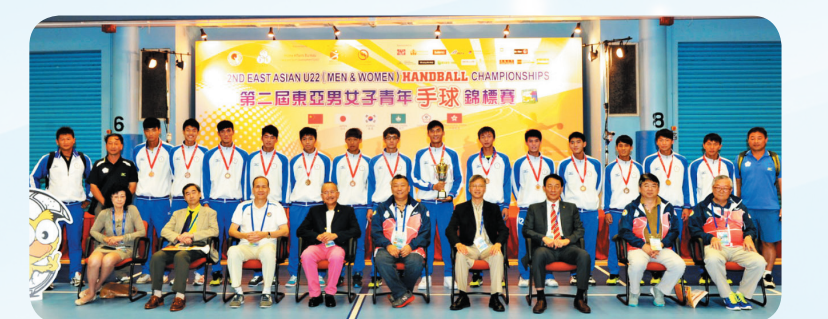
男子手球代表獲得銅牌 體合影