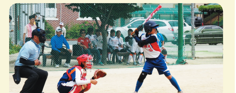
古慈新選手比賽剪影