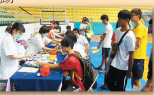
學生健康檢查抽血情況