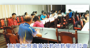
103學年度專任教師教學座談會