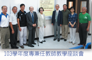
103學年度專任教師教學座談會