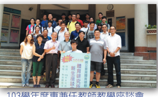
103學年度專任教師教學座談會