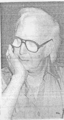
支著腮幫子想想，漫天璀璨的影像就如潮水般湧來。尼可萊斯以豐富的想法力在舞壇著名。

這次演出的作品大多是新作，包括一張力情境、影像遊戲、接觸、祭典、萬花筒、圖、機械語言、群舞等。 其中「圖」是由美國舞蹈節委託創作，斥資百萬元以上，尼可萊斯自己稱為「金字招牌」。 尼可萊斯曾於六十五年、六十八年兩次來訪，他這是第三次來訪，演出時間地點是：三、四、五日在台北國父紀念館，六日在台中中興堂，七日在台南市立文化中心，八日在高雄中正文化中心。 入場券保留部分在會場門口發售。