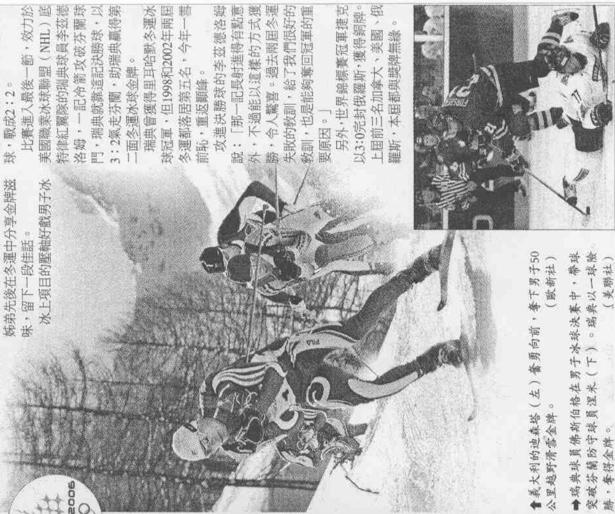
義大利的迪森塔(左)奮勇向前，奪下男子50公里越野滑雪金牌。