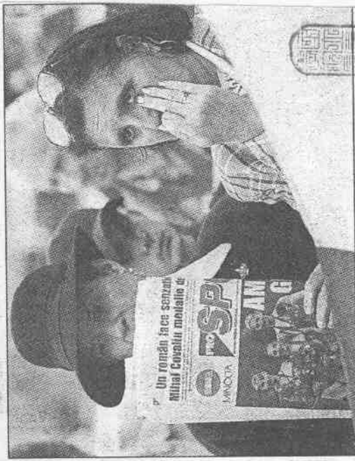
↑站在街頭的羅馬尼亞婦女眼眶含淚，她們爲拉都肯翻案失敗，無法要回女子體操金牌同感傷心。

所幸，這項比賽的二、三名都是羅馬尼亞人，在各向上提升一名後，金牌還是留在羅馬尼亞隊中。