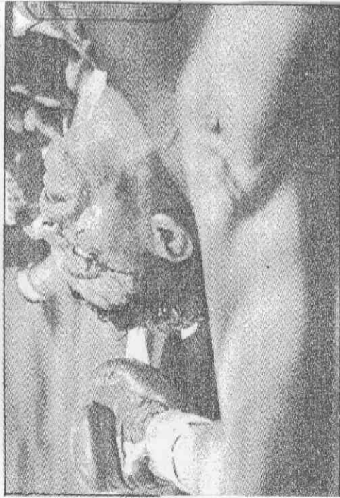
▲前大吹牛皮的拉隆德，於第九局被打倒，醒不醒，臉還半流血。

●李德納在週一擊敗拉隆德之後，使他成為世界拳擊史上，第一個保有五個不同量級拳王頭銜的拳擊手。他的職業拳擊戰績如下： 一九七九年十一月廿日，在拉斯維加斯於第十五回合擊倒貝尼德茲，贏得世界拳擊理事會(WBC)輕中量級拳王寶座。 一九八〇年十一月廿五日，在紐奧良於第八回合擊倒杜南，獲獎WBC輕中量級拳王頭銜成功。 一九八一年六月廿五日，在休士頓於第九局擊倒卡路雷，贏得WBA次中量級拳王頭銜。 一九八一年九月十六日，在拉斯維加斯於第十四局擊倒希恩斯，再度成功衛冕WBC輕中量級拳王頭銜。 一九八七年四月六日，在拉斯維加斯於打完第十二局後，以些微點數優勢，擊敗哈格勒，贏得WBC中量級拳王頭銜。 一九八八年十一月七日，在拉斯維加斯於第九局擊倒拉隆德，同時贏得WBC輕量級及超中量級拳王頭銜。 李德納這場獲勝後，使他的職業拳賽戰績為卅五場勝，一敗，其中廿五場擊倒對手。(林滄陳)