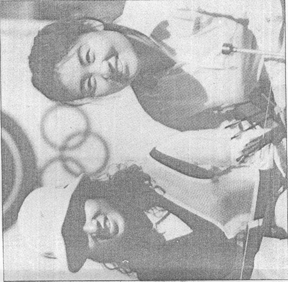
、(左)美芳賴手箭女的岸兩峽海馬 晉雙雙後賽複賽人個在天昨，君湘 (真傳城漢報本) 美比妹雙 。賽決準的天今加參將，級