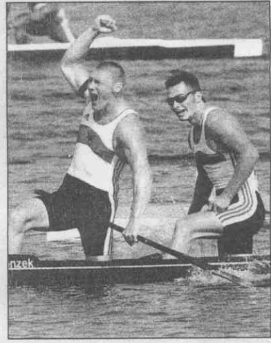
↑德國名將蓋利 (Christian Gille；左) / 伍蘭茲科 (Tomasz Wylenzek) 27 日於男子 C2 1000m 獨木舟決賽為德國再添一金。

●德國名將蓋利 (Christian Gille) / 伍蘭茲科 (Tomasz Wylenzek) 27 日於男子 C2 1000m 獨木舟決賽為德國再添一金。「家鄉支持我們的鄉親之前就說，我們一定能拿金牌。」蓋利激動的表示：「現在我們真的成功了，真不敢相信。」 (林欣樺)