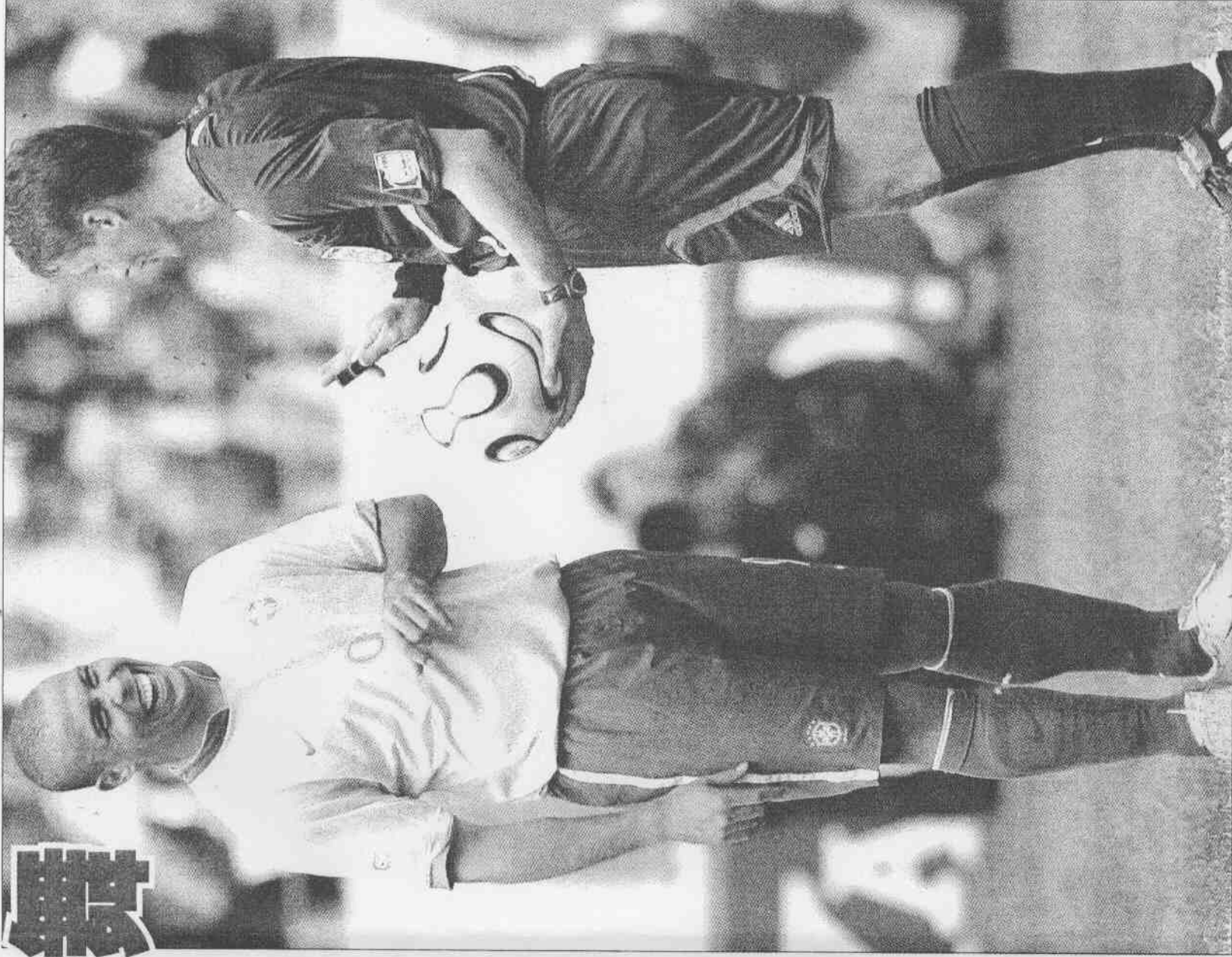
▲斯洛伐克籍的主審米歇爾(右)，向羅納多要球衣，被迦納隊檢舉有違職業道德。

在訓練的尾聲，佩雷拉還安排了9名球員練習12碼球，其中8人射3次，只有羅納多踢了4次，進了3個，在總共的28腳打門中，迪達只守住了3個。