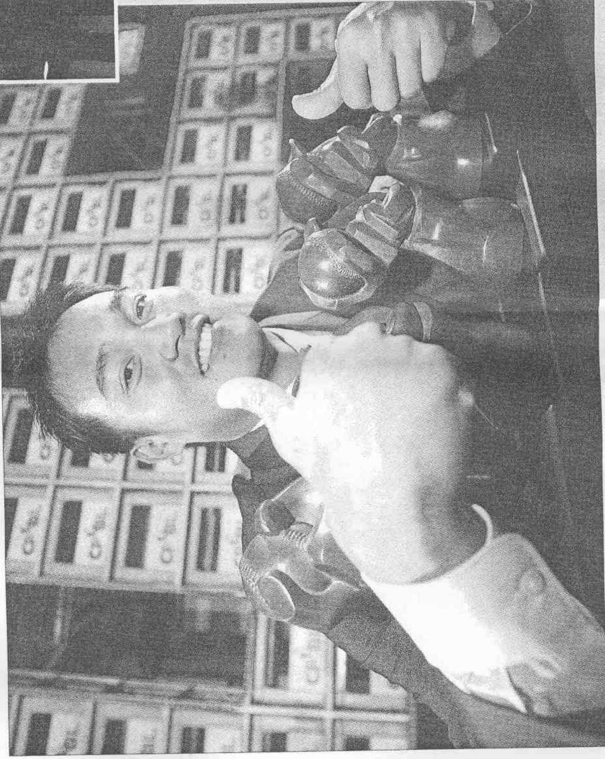
↑統一獅高國慶獲得金手套獎後，親吻母親。

他說：「緊張比興奮多一點，因為不瞭解對手，怕打不好。」加上去年熊隊得到亞軍，讓他肩上的擔子暫時還放不下，表示：「壓力很大。」