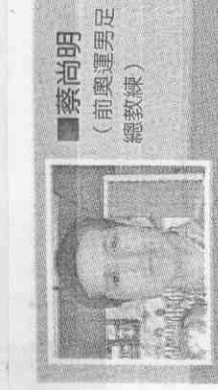
■蔡尚明 (前奧運男足總教練)

年，在荷甲埃因霍溫、2004-05年在英超切爾西、2007-08年在西甲皇家馬德里以及2009-10年在德甲拜耳慕尼黑都能賣力幫助球隊奪取冠軍。 本屆來到南非，羅本再次因傷缺席前兩場預賽，不過，在與喀麥隆之戰中下半場羅本傷癒歸隊，在他的靈活策動下，荷蘭得以3戰全勝闖進16強。 「雖然我還沒有完全恢復，也沒能調整到最佳狀態，但有絕對信心能帶領祖國奪取最佳成績。」羅本表示。