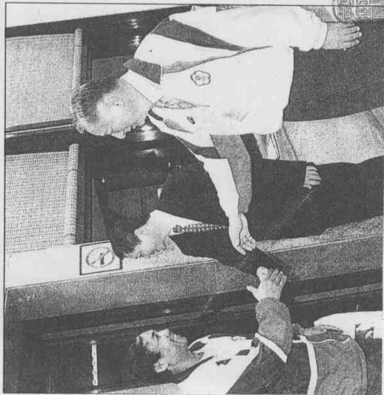
▲代表團成員與官員合影。