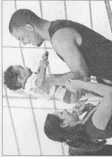
◀巴西名將羅納度(右)練球完後，與隊友壞的孩子玩了起來，露出大男孩的赤子之情。