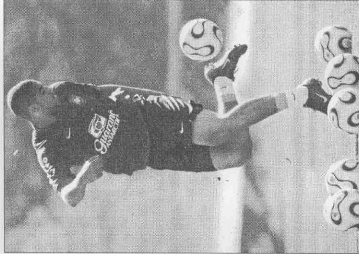
◀巴西阿德里亞諾11日練球時，大秀踢球絕技。