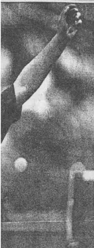
女單準決賽中，擊敗大陸這場球，發揮她的反手拍。