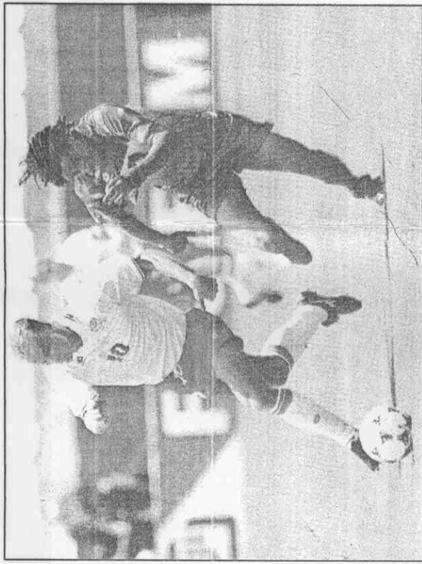
↑荷蘭明星球員博格坎普(左)盤球疾走，摩洛哥的後衛瑞基在後緊追不捨。法新社/傳真

德的中場攻擊手，如今已經出席國際大賽達四十一場，進球數累積達二十四球，其中包括去年在會外賽與澳門之役中大演帽子戲法個人獨進三球。