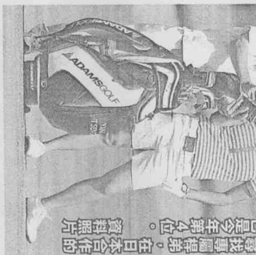
尋找專屬桿弟，在日本合作的 是今年第4位。 資料照片

接著在牙買加舉行LPGA的Mojo 6女子賽、上周在日本茨城縣的世界女子錦標賽，妮妮的桿弟都不同，她說：「其實我在球場上都會和桿弟一起討論，就算意見相左也沒關係，但我希望桿弟的判斷要夠水準才行。」 桿弟沒著落，但妮妮的教練團已有