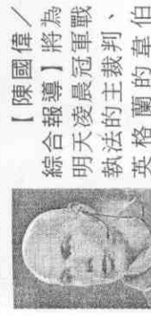
【陳國偉／綜合報導】將為明天凌晨冠軍戰執法的主裁判、英格蘭的韋伯(Howard Webb，見圖)，現年38歲，非足球季兼職警長，本屆預賽，韋伯曾擔任西班牙vs.瑞士的主裁判，當時西班牙0

自1982年以來的7屆世界盃，單屆最高進球數為2002年巴西羅納度(Ronaldo)8球，最少進球數是上屆2006年德國克洛澤(M.Klose)5球，以斯奈德和畢亞近況、企圖心來看，冠軍決賽肯定叫好好又叫座！