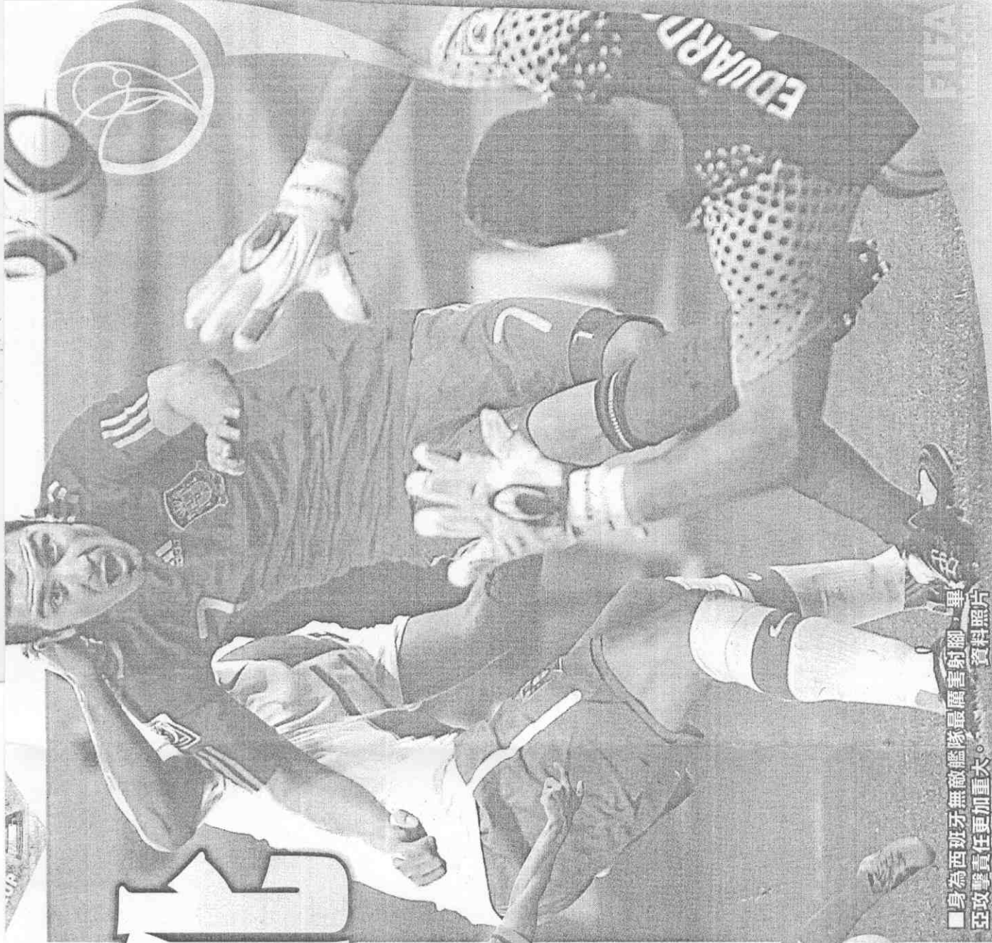
■身為西班牙無敵艦隊最厲害射腳，畢亞攻擊責任更加重大。