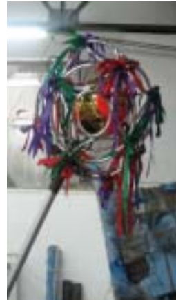
圖 2-8 開放式龍珠

2. 龍頭：對於競技舞龍的龍頭規定較為嚴格，連重量都有其限制，不得少於 3 公斤，但龍珠、龍身與龍尾的重量是不限制。而龍頭尺寸，寬不少於 0.36 公尺；高不少於 0.6 公尺；長不少於 0.9 公尺；桿高不低於 1.25 公尺。龍頭含桿高不低於 1.85 公尺（圖 2-9）。