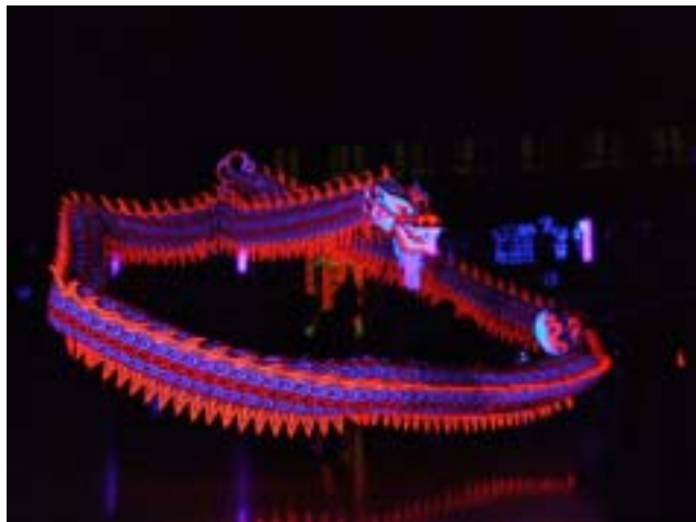
圖 2-1 2008 年亞洲龍獅錦標賽夜光龍比賽

現今舞龍比賽，除了競技龍〈也稱日光龍〉之外，還有夜光龍（圖2-1）。世界上第一條夜光龍出現在1967年新加坡的繁華世界體育館，這是一種不同於一般舞龍的表演方式，顧名思義即是在比賽場地中將所有照明設備關閉，開設專用的紫光燈，而龍身運用夜光材質的顏料著色，在舞動過程中，龍身因紫光燈的照射，有夜光發亮的效果，而運動員則穿著全黑的衣物，佩帶號碼牌，以利裁判評分辨識，舞龍時只見龍身，不見舞者，加上動作順暢，一氣呵成，讓龍的形態活靈活現，令人驚嘆（國立傳統藝術中心，2007）。