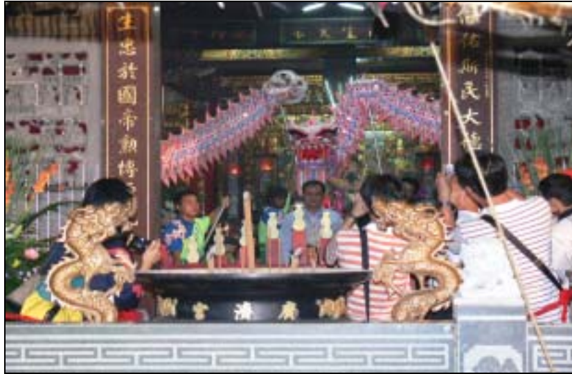
圖 3-1 廟會慶典舞龍