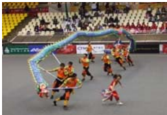
圖 2-3 遊龍動作

（二）遊龍動作：運動員以大幅度奔跑遊走，通過龍體快慢有致、高低、左右的起伏進行，展現婉轉迴旋，屈伸綿延等龍的動態特徵（圖 2-3）。動作要求：龍體循著圓、曲、弧線的規律運動，運動員協調地隨龍體的起伏前進。