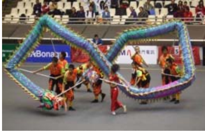
圖 2-6 組圖 C 級難度動作—大橫 8 字花慢行進