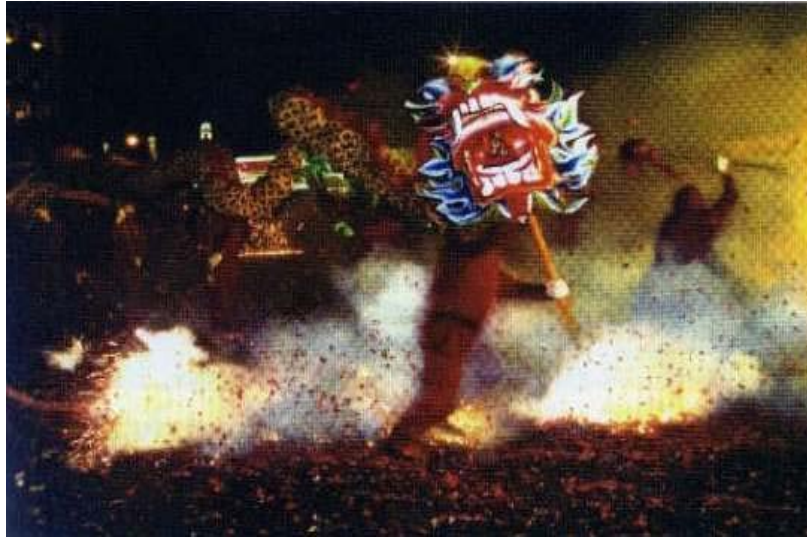
圖 3-8 苗栗火旁龍

成份，每一年參加炸龍的社會民間隊伍 10 到 20 隊，都有民間自行成立組隊參加（陳明信，2006）。