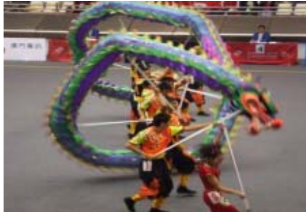
圖 2-5 翻滾 C 級難度動作—快速連續螺旋跳龍