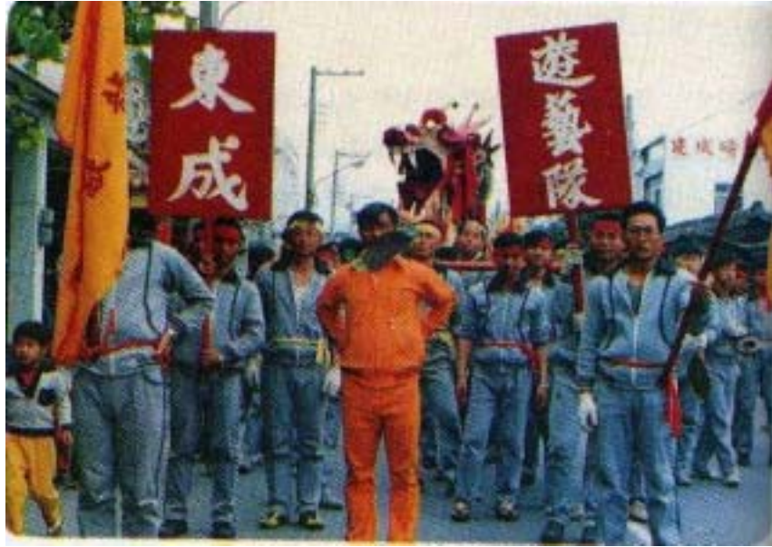
圖 3-6 臺東東成營區龍隊