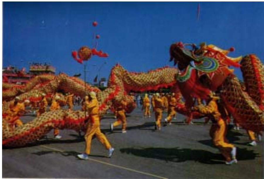
圖 3-7 國慶日舞龍表演