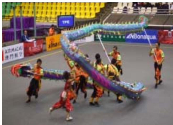
圖 2-4 穿騰 C 級難度動作—連續穿越騰越行進

（三）穿騰動作：龍體運動路線呈縱橫交叉形式、龍珠、龍頭、龍節依次在龍身下穿過，稱「穿越」；龍珠、龍頭、龍節依次在龍身上越過，稱「騰越」（圖 2-4）。動作要求：執行動作時，龍形保持飽滿，速度均勻，運動軌跡流暢，穿騰動作輕鬆流利，不碰踩龍體，龍體不拖地停頓。