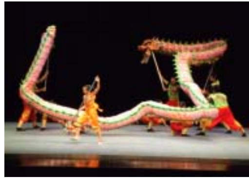
圖 4-1 宜蘭傳統藝術中心表演