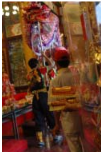
圖 3-2 2006 年嘉義紫微宮廟會出陣表演—入廟

舞龍在臺灣依表演的方式不同，而有北部龍與南部龍之分。北部龍的龍身較長、重量較重，舞龍時有較多的動作在原地穿節、解結，因而特別講究穿節、解結的技巧，以及動