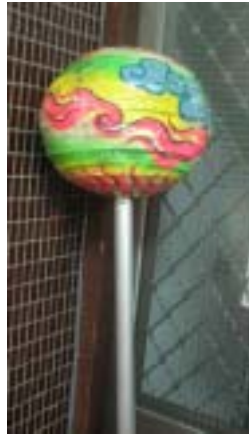
圖 2-7 封閉式龍珠