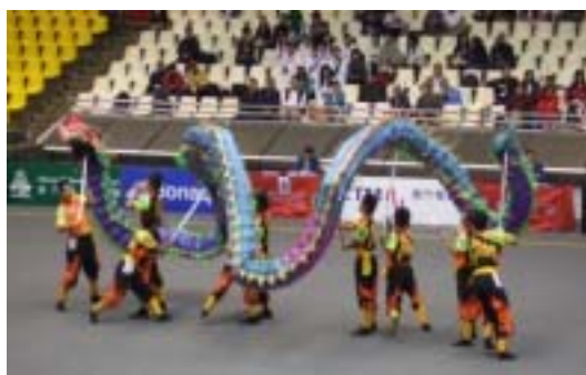
圖 2-2 8 字舞龍 B 級難度動作—繞身 8 字舞龍

（一）8 字舞龍動作：運動員將龍體在人體左右兩側交替動作 8 字形環繞的舞龍動作（圖 2-2），可快，可慢，可原地，可行進，也可利用人體組成多種姿態，多種方法做 8 字形狀舞動。動作要求：龍體運動軌跡要圓順，人體造型要優美，快舞龍要突顯出速度、力量；每個動作左右舞龍各不少於 4 次；單側舞龍每個動作上下各不少於 6 次。