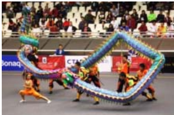
圖 2-11 九節布龍所構成之競技龍