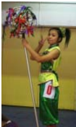
圖 2-12 中華隊威勁武術龍獅戰鼓團持龍珠者

（四）服裝：國際舞龍舞獅競賽規則（2002）中說明，比賽時，運動員應穿具有特色的表演服裝。要求穿戴整潔，服飾款式色彩須與舞龍器材相協調，而手持龍珠的隊員應與舞動龍的隊員有明顯的區別，但對於鼓樂隊員的服裝則較無限制。再來就是運動員上場比賽必須佩戴號碼，執龍珠者為「0」號（圖 2-12），執龍頭者為「1」號（圖 2-13），其餘依次順延，替換隊員、樂隊伴奏（圖 2-14）的隊員均佩戴號碼，以利裁判員評判。