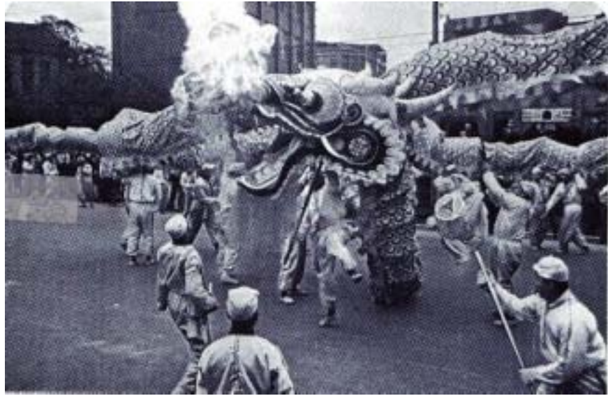
圖 3-4 四四中華巨龍