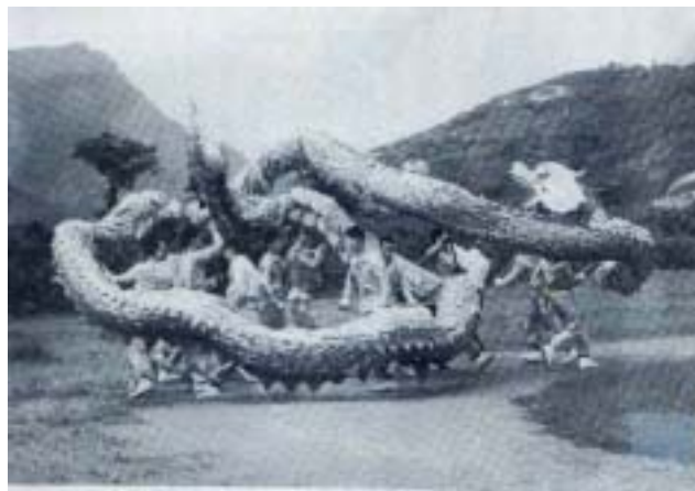
圖 3-3 光華龍隊

再來是軍中舞龍。吳富德（1988）提到民國52年，國軍為了響應復興中華文化運動，發展傳統的民間藝術，及下令要軍隊配合實施，當時最有名的國軍龍隊有光華龍隊（圖3-3）、四四中華巨龍（圖3-4）、台北陸軍龍隊、左營海軍龍隊、屏東潮州陸軍龍隊（圖3-5）、台東東成營區龍隊（圖3-6）等等，每每在國慶遊行時即出動國軍巨龍隊（圖3-7），場面之浩大壯闊，深受民眾喜愛。