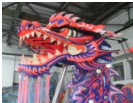
圖 2-9 龍頭

2. 龍頭：對於競技舞龍的龍頭規定較為嚴格，連重量都有其限制，不得少於 3 公斤，但龍珠、龍身與龍尾的重量是不限制。而龍頭尺寸，寬不少於 0.36 公尺；高不少於 0.6 公尺；長不少於 0.9 公尺；桿高不低於 1.25 公尺。龍頭含桿高不低於 1.85 公尺（圖 2-9）。