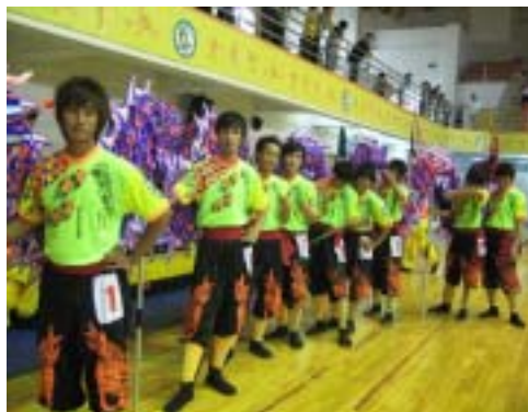
圖 2-13 中華隊威勁武術龍獅戰鼓團舞龍隊員