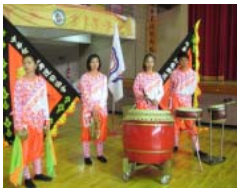
圖 2-14 中華隊威勁武術龍獅戰鼓團樂隊成員

由於競技舞龍目前大多是以高中以上學生及成年人所從事之，但每項運動皆希望能從基層開始推廣，向下紮根，因此對於孩童的使用器具也有不同的規定，不過少年組與孩童組的器材尺寸規定，是以每場比賽的競賽規程所制定，目前國際規則中較無明確的訂定辦法。