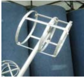
圖 2-10 龍身內部結構—龍節