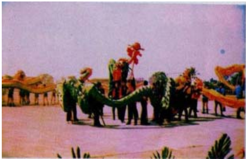
圖 3-5 屏東潮州陸軍龍隊