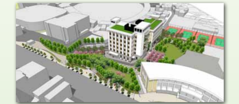
運動科學綜合大樓示意圖

● 臺中校區運動科學綜合大樓新建工程 本工程總預算為新臺幣2億5千萬，全案於101年2月正式委託營建署全程代辦，並於101年6月12日與余曉嵐建築師事務所完成設計監造技術服務契約簽訂，並自101年11月9日起進入細部設計階段，目前已將30%規劃設計成果報請教育部核轉行政院公共工程委員會審議中；另都市設計審議部分同步向臺中市政府都市設計委員會申請中，全工程預計於102年12月辦理工程發包，103年2月動工，104年7月完工驗收。