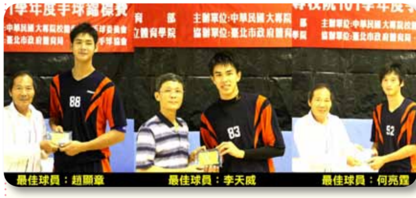
最佳球員：趙顯章 最佳守門員：李天威 最佳球員：何亮霆