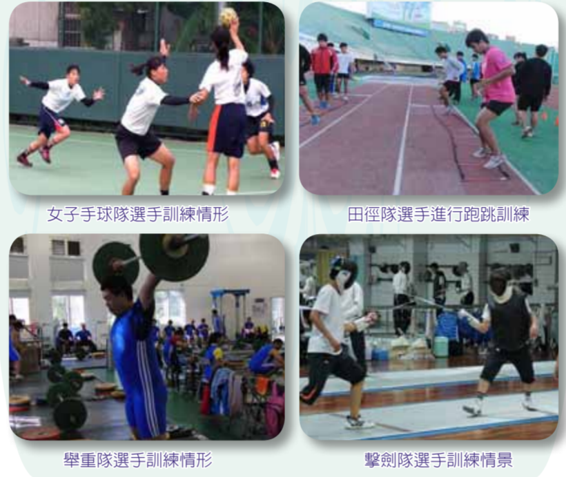
女子手球隊選手訓練情形 田徑隊選手進行跑跳訓練 舉重隊選手訓練情形 擊劍隊選手訓練情景

102年度暑假集訓期間自7月1日起至9月6日止，共有田徑隊、自由車隊、舉重隊、柔道隊、跆拳道隊、拳擊隊、射箭隊、擊劍隊、角力隊、棒球隊、軟式網球隊、手球(男、女)隊、籃球(男、女)隊、排球(男、女)隊、足球(男、女)隊、桌球隊、羽球隊、壘球隊、橄欖球隊、網球隊、健力隊、空手道隊、劍道隊、保齡球隊及划船隊等29隊參加。