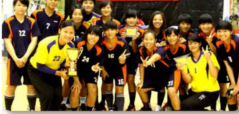
協辦單位：臺北市政府體育局、中華