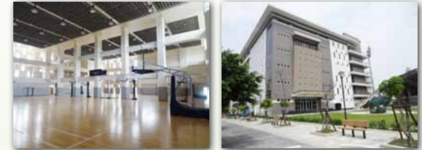
教學大樓新建工程完工照片

● 臺中校區教學大樓新建工程 本工程於101年12月29日全部完工，代辦機關營建署分別於本(102)年1月25日及4月24日辦理完工初驗及正式驗收，全案於同年5月3日取得使用執照；學科及術科大樓後棟室內裝修工程於9月上旬陸續完工，並於9月9日起開放學科大樓第一、二樓供上課使用。