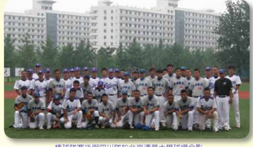
棒球隊賽後與四川隊於北京清華大學球場合影

本校棒球隊為國內大專勁旅，近幾年在國內大專及業餘成棒的各项賽事皆名列前茅，101學年度拿下大專棒球聯賽冠軍及蟬聯全國盃主賽冠軍，成績相當亮眼。今年七月暑假期間，前往中國天津、北京移地訓練及交流比賽，並在十天行程進行八場球賽，以五勝三敗戰績結束移地訓練。