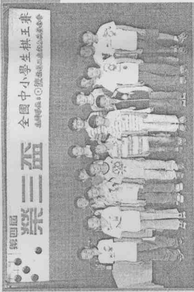
16名小學組入圍者(上圖)與16名中學組入圍者(下圖)。