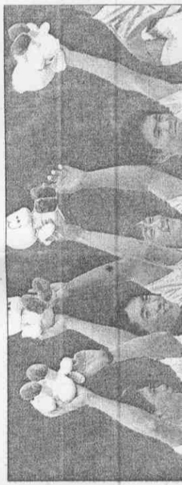
特派記者 張福興／廣島傳真