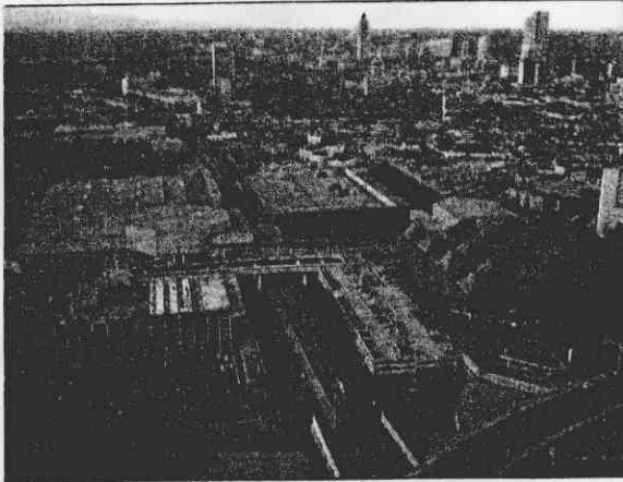
↑這是奧林匹克中心的景觀，世界會議中心部份做為比賽場地，部份做為新聞中心。