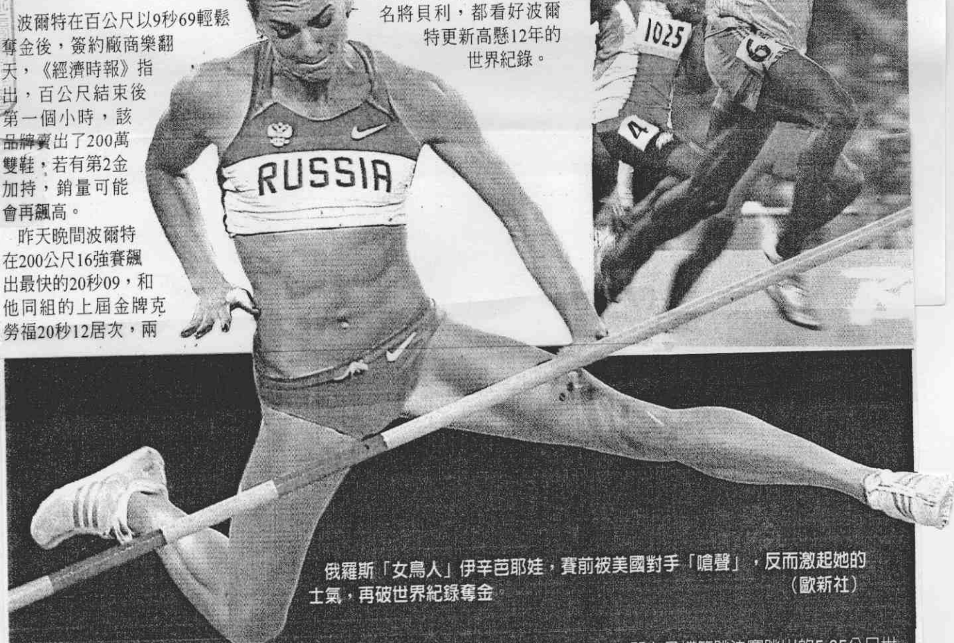
俄羅斯「女鳥人」伊辛芭耶娃，賽前被美國對手「噎聲」，反而激起她的士氣，再破世界紀錄奪金。