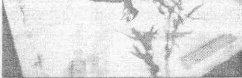
家畫如才人出傑，差件條質物陸大▲ 小偏就間房的到分(子弟石白齊)照世盧 (平北於攝興福張)