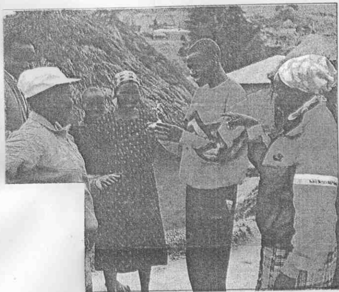
↑依照族裡的習俗，奇波把參加比賽的榮耀和隣人分享。