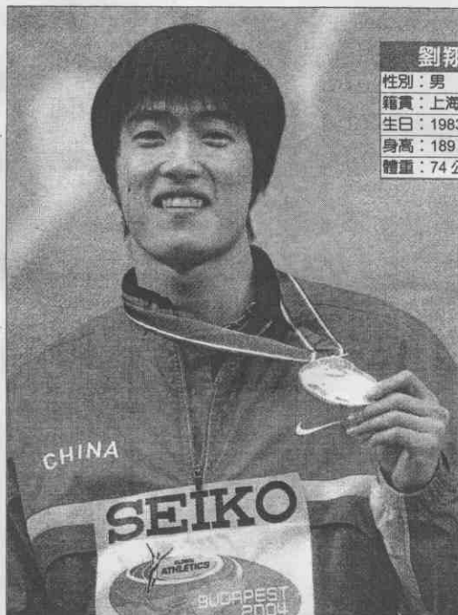
徑選手。劉翔是在今年雅典頒獎台上最有機會胸前掛著金牌的田徑選手。田總排名高居世界第一，只落後亞特蘭大金牌得主強那森 13 秒 05。← 110 高欄劉翔具有 13 秒 06 的世界級水準，在今年世界