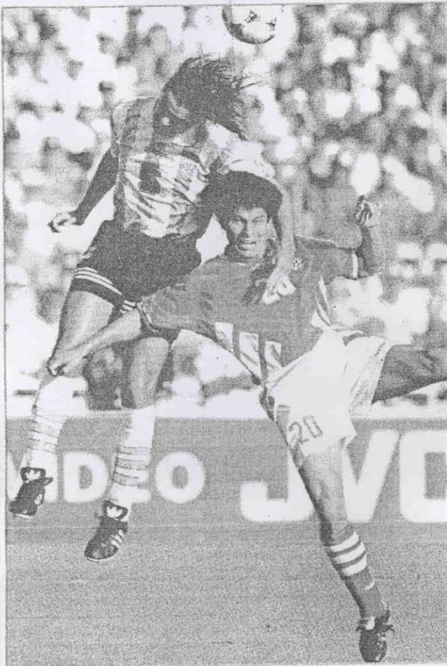
會阿根廷隊中場雷東多(左)與保加利亞隊中場巴拉柯夫，奮力躍起以頭槌爭球。