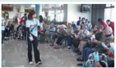
媒體報導本校參與運動志工活動之剪影