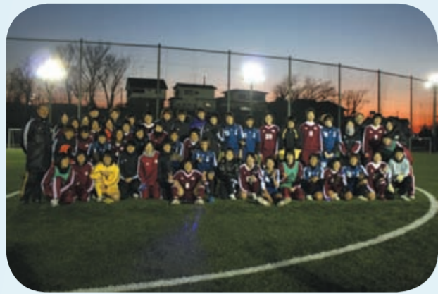
與早稻田大學進行比賽並於賽後合影