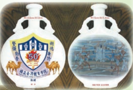
附圖1：A款（瓶身後兩面圖樣參考）

慶祝母校國立臺灣體育學院50週年校慶~校友總會募款活動歡迎大家共襄盛舉！！ 活動時間：100年6月12日 活動地點：國立臺灣體育學院 活動說明：1.捐款達$1,000元者致贈「慶祝母校50週年校慶紀念酒」（樣品詳附圖1-2）乙瓶（捐款達$2,000元致贈2瓶、達$3,000元致贈3瓶...以此類推）。 2.本案捐款扣除校友總會相關管銷費用後，全數捐贈母校國立臺灣體育學院。 3.本次捐款由校友總會開立證明(僅作收款證明)。 備註：本次活動由國立臺灣體育學院提供行政協助，活動查詢請洽國立臺灣體育學院育成中心（04-22213108轉2092或2093）。