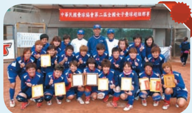
本校女子壘球隊勇奪總冠軍暨個人獎項，並於賽後合影。