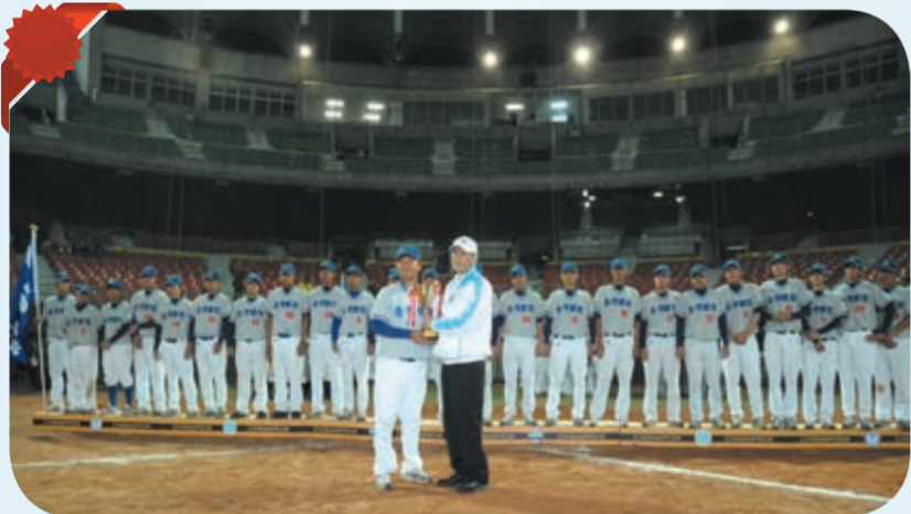
本校棒球球隊勇奪大專聯賽亞軍頒獎。