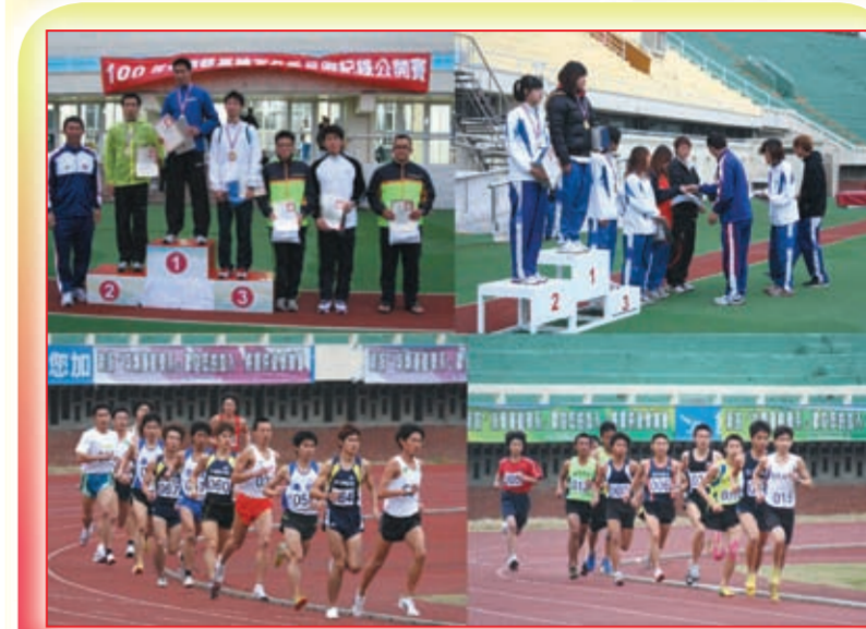
「100年全國暨臺體盃冬季長跑紀錄公開賽」賽會剪影

本賽會業於100年2月19日(星期六)下午在本校田徑場辦理完成，其中參賽人數計87人，共分為五組進行5000公尺之比賽。本次除出賽選手獲頒成績證明外，每組前六名皆頒發獎狀及獎品。本次賽會吸引來自高中、大專院校、愛好長跑之社會人士參與，及在許績勝老師積極努力下，獲得廠商贊助，致使賽會圓滿達成，並期許於未來能持續推動國內之長跑運動。