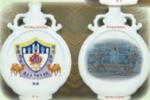
附圖2：B款（瓶身後兩面圖樣參考）