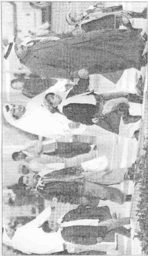
多哈亞運閉幕卡達民衆扶老攜幼穿著傳統服飾參加閉幕典禮。

2010年亞運的承辦城市廣州，以10分鐘表演「東方神韻」歌舞，把亞運體壇的重心的阿拉伯神話，轉換成「龍之國度」深遠歷史，閉幕高潮則是中國書法家慎召民當眾揮毫，以重達30公斤的毛筆，寫下「和諧亞洲」的巨幅字畫，相許4年後再見。