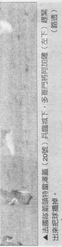
▲法國隊前頭特雷澤蓋(20號)兵臨城下，多哥門將阿加薩(左下)趕緊出來把球攔掉。

本屆共有8支第一次參加世足賽的球隊，包括非洲的象牙海岸、多哥、安哥拉與迦納；美洲的千里達、東歐的烏克蘭、塞爾維亞與捷克，其中只給緊張的比賽增添一些趣味。