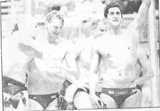
↑美國四百公尺自由式接力隊贏得奧運金牌後，在池畔慶賀。