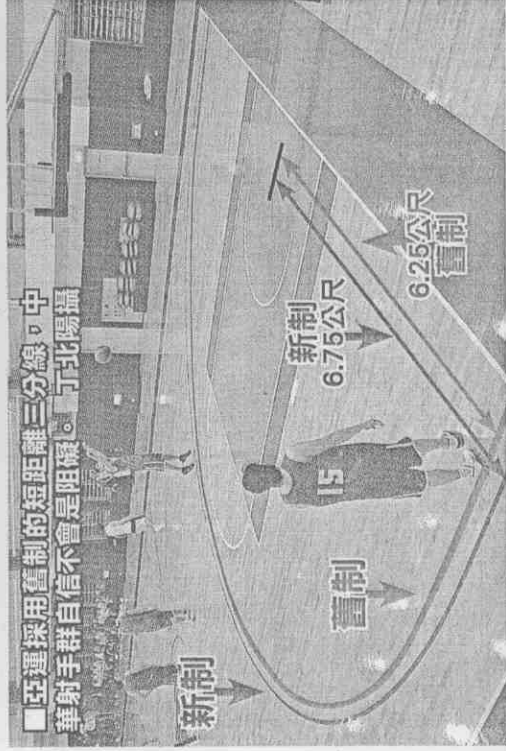
■亞運採用舊制的短距離三分線，中華射手群自信不會是阻礙。

由NIKE所贊助的中華男籃戰袍大有來頭，質料與樣式和今年世錦賽金牌軍美國男籃屬同一系列，最大特色是網狀織布，既達到減輕重量目的，又可以加速排汗，幫助球員在激烈的比賽中減輕負擔、調節體能。(蔡裕隆)