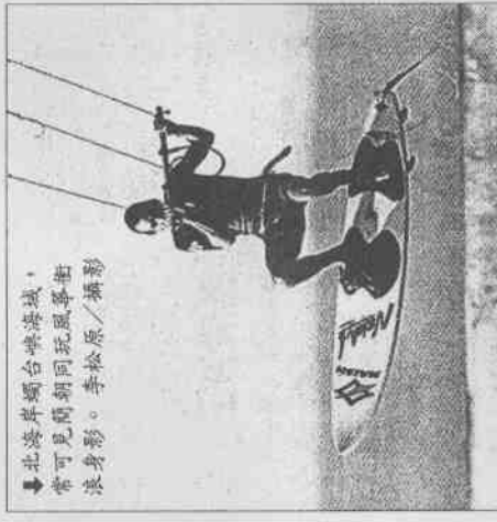
北海岸同好玩風箏衝浪，常見於同好聚會。

進入第二代的風箏衝浪器材，在體積和適水性上有了很大的變革，首先是運動風箏那分，完全無骨軟式風箏，加上主要的支撐骨架，並以不透水的材質製作，最特別的是，風箏落水後會在水面浮起。至於衝浪板，除了維持腳套和繫繩，整個衝浪板縮小尺寸，使玩者能更輕巧地操控，並做出各種跳躍動作。