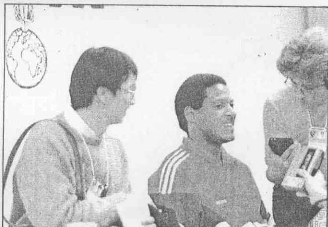
▲。將女球鉛級界世名一另是，紅志黃娘姑「胖」州杭