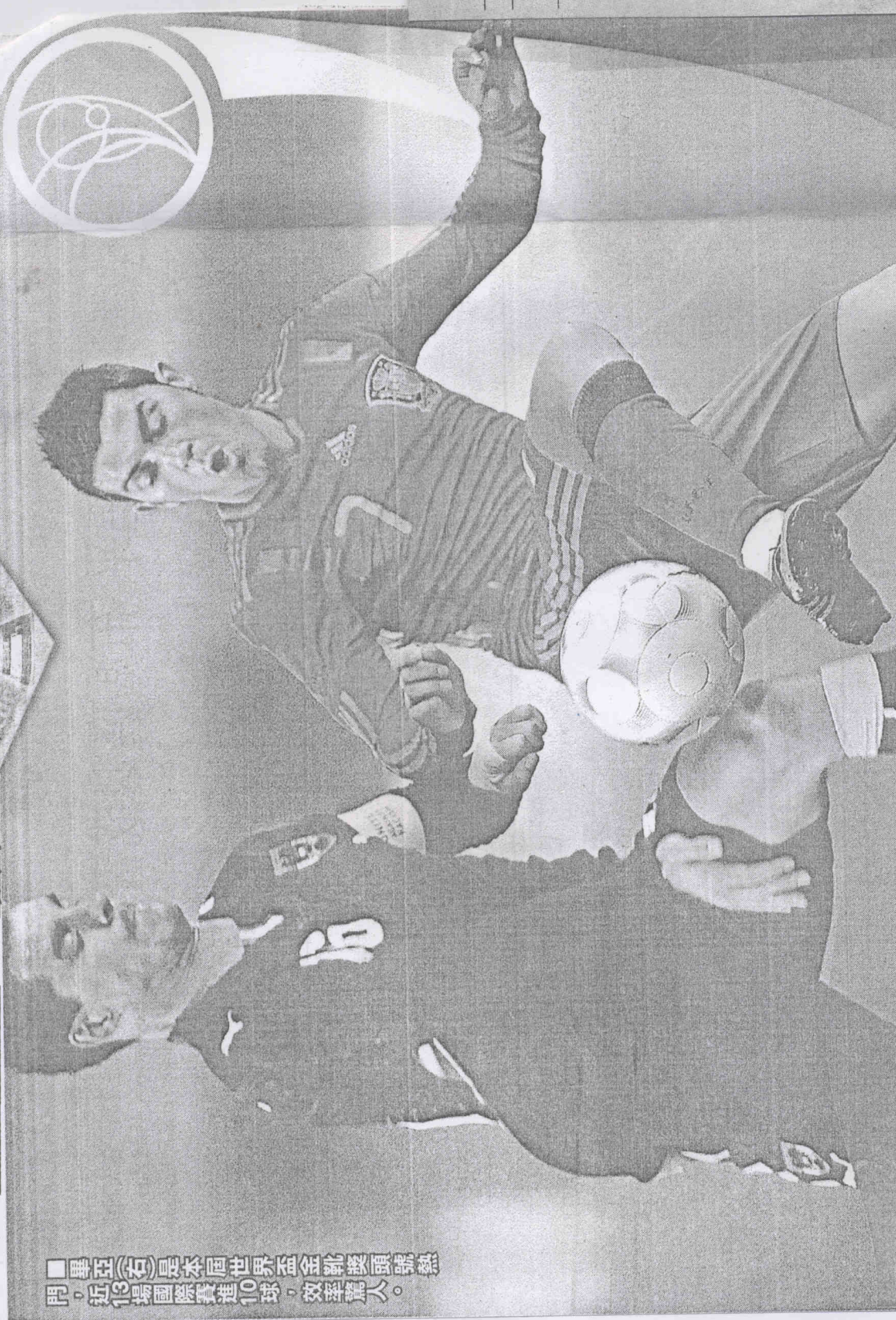
■畢亞(右)是本屆世界盃金靴獎頭號熱門，近13場國際賽進10球，效率驚人。