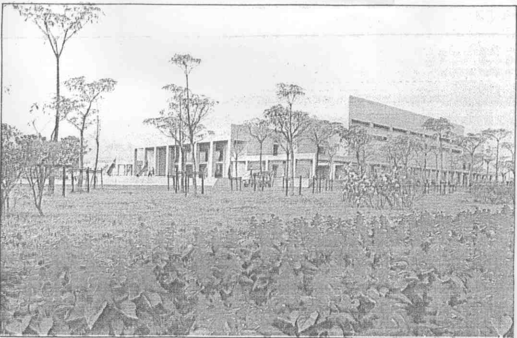
▲化園公場動運，花鮮的麗艷有還，院庭廣寬有、廊迴有，館育體蘭宜的成落剛▲