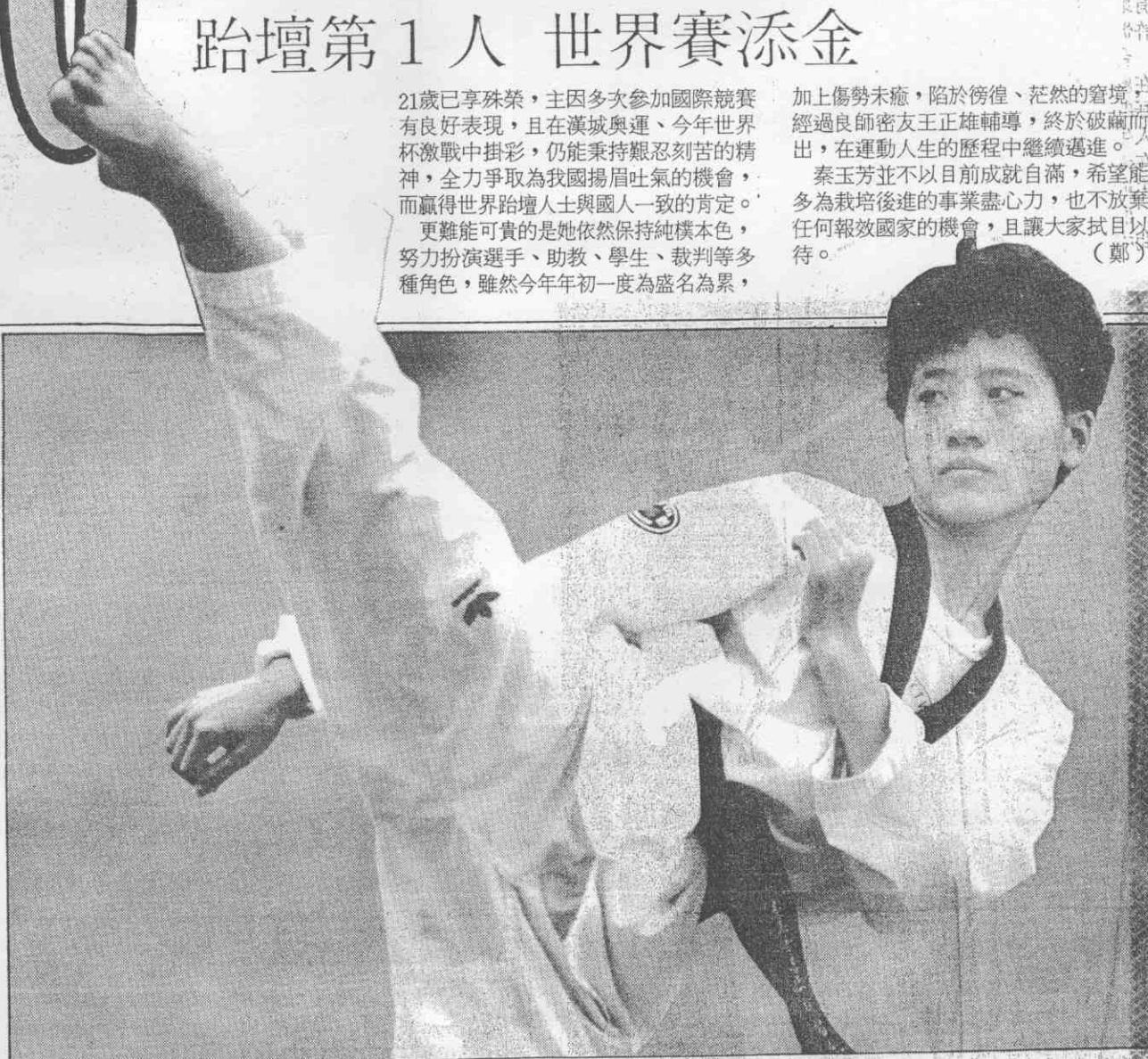
↑秦玉芳先後在奧運、世界賽勇奪金牌，為我國跆拳道第一人。

2年前新加坡亞洲田徑賽，中華隊留下「零金牌的遺憾」，李福恩本屆率先奪下第1面金牌，不但意義非凡，也燃起明年北平亞運奪標的希望。 (群)