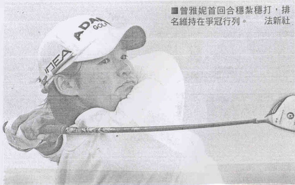
■曾雅妮首回合穩紮穩打，排名維持在爭冠行列。