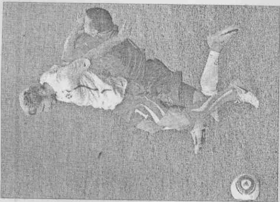
▲瑞士的貝拉米手肘肘打子打在智利後衛比達爾臉上，被裁判以直接紅牌罰下。

▲葡萄牙隊卡瓦略(左)在北韓球員的防守下，仍起腳勁射，此役葡萄牙以7比0大破北韓。