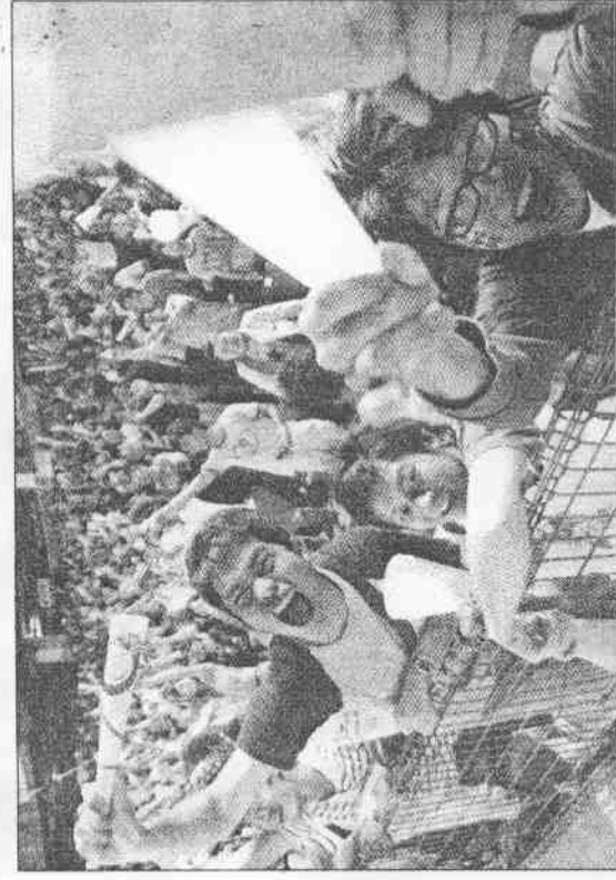
好戲登場 球迷捧場

▲洲際盃棒球賽四強戰，中華再戰古巴，熱情球迷在臉上畫上國旗圖案買票入場。