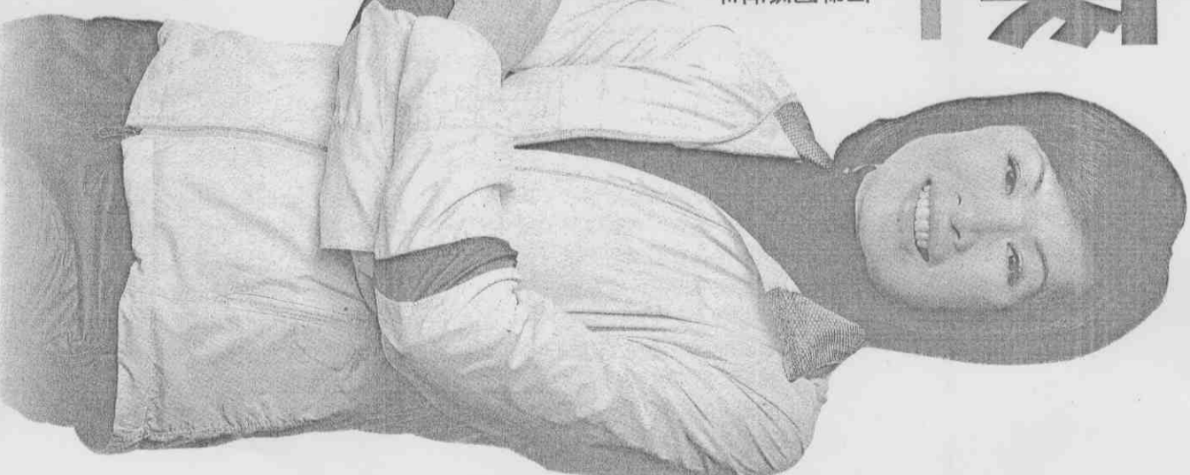
行政院體育委員會戴遐齡主委，臺灣有絕對的能力與實力，申辦東亞運和亞運。