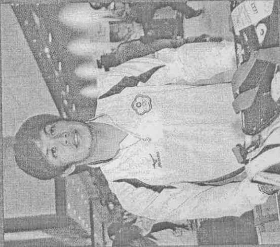
▲中華棒球隊昨日返台，到場接機球迷並不多。