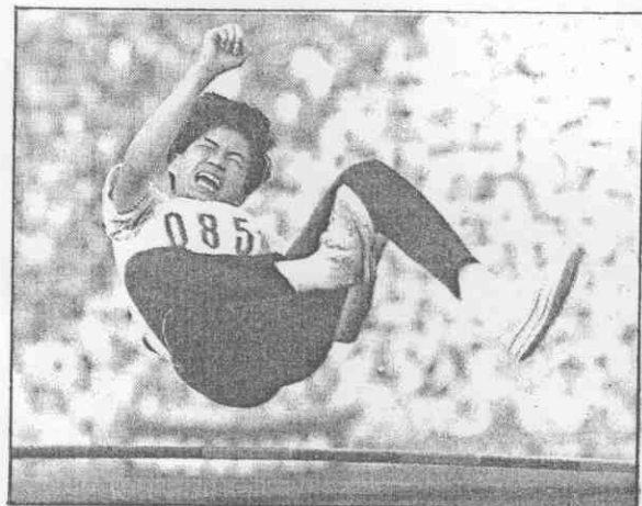
。足十勁拚，高跳賽比手選班聰啟▲